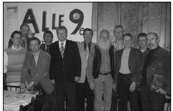
Die Sprecher der Arbeitsteams mit engagierten Bürgern stellten die wichtigen Ziele aus den fünf Arbeitskreisen vor.