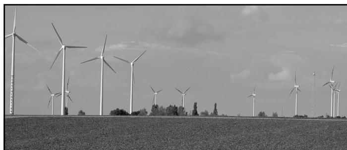
Noch aus Zeiten, als die vier Windräder (links im Bild) noch am Steinberg nebeneinander standen und ihre Arbeit verrichteten

Früher als erwartet wird damit eine Frage beantwortet, die vor dem Bau dieser Windkraftanlagen umfassend erörtert wurde: Was ist, wenn die Windräder nicht mehr ihren Dienst versehen (können). Ist dann auch Geld für den Abbau vorhanden? Manche vermuteten damals sogar, dass Firmen in die Zahlungsunfähigkeit geleitet werden könnten, um sich damit die Kosten für den Abbau zu ersparen, der dann