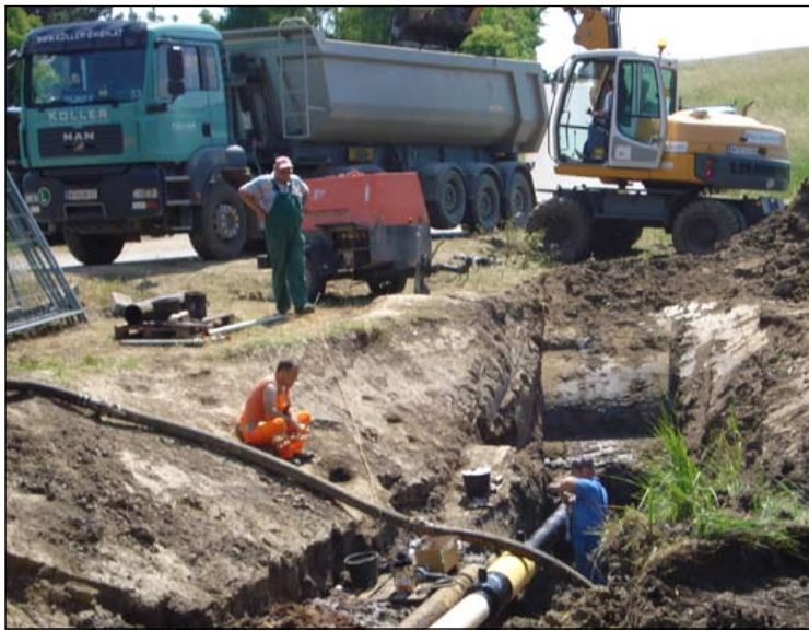
Sondereinsatz nach einer undichten Erdölleitung am Kirchensteig am 15. Mai. Der Schaden war rasch behoben. Umfangreicher war der Austausch des Erdmaterials.